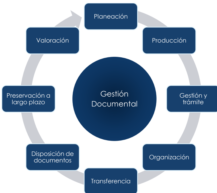
Ilustración 1 Procesos de la gestión documental

Para cada proceso se definirá los lineamientos y actividades de corto, mediano y largo plazo que permitirán implementar un modelo de gestión documental estandarizado en la Rama Judicial y darán cumplimiento a requerimientos de tipo administrativo, legal, funcional o tecnológico.